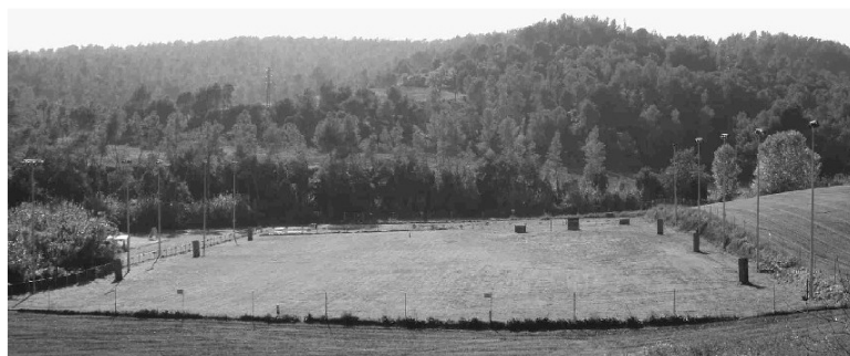
Vista general de las instalaciones, 8.500 m 2

Información disponible en www.canroja.com